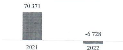
Фінансовий результат від операційної діяльності, тис.грн.

Валовий прибуток за 2022 рік складає 36 541 тис. грн. Фінансовий результат від операційної діяльності Товариства зменшився, в основному за рахунок спаду чистого доходу від реалізації продукції (товарів, робіт, послуг) на 55%, в порівнянні з аналогічним періодом 2021 року через зменшення доходів Готелю, спричинене введенням воєнного стану в державі, а також за рахунок зменшення інших операційних доходів до 5 395 тис.грн., що складає 63% минулорічного результату.